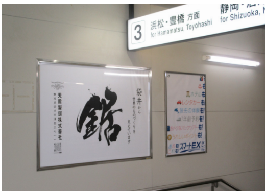
▲JR袋井駅構内に掲出されている天龍製鋸の広告

直近の業績については、過去最高の売上高を記録してから2期連続で減収となっております。しかし、2023年度の売上高は直近10年で4番目に高い実績を上げており、特需の後の厳しい中でも健闘しています。